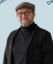
Edith Haarhof Design de bureau 3D